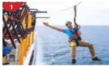
Ropes Course & Zipline Feel the thrill of gliding above the ocean on a 35-metre zipline.