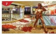
Johnnie Walker House™ Immerse yourself in the intricate world of premium Scotch whisky.