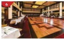
Dream Dining Room Savour a wide variety of Asian and international cuisine.