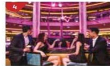
Bar 360 Catch live music and aerial acrobatic performances with a glass of champagne.