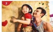
Rock Climbing Wall Challenge yourself on our mountainous rock climbing wall.