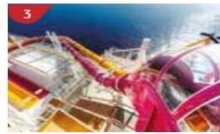
Waterslide Park Get drenched in fun on one of our six different waterslides.